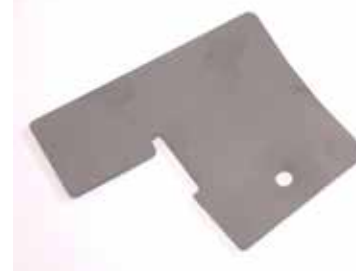
Tôle Acier 3 mm