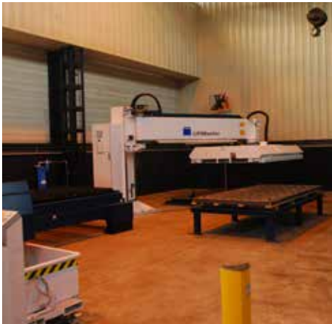
Chargement / déchargement automatique