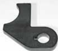
Pièce de structure 8 mm