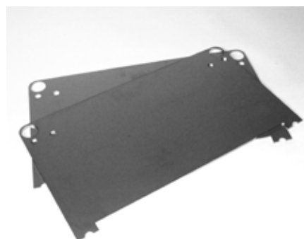
Tôle Inox 2,5 mm