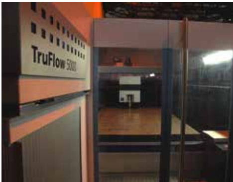
Unité et procédé de découpe Laser