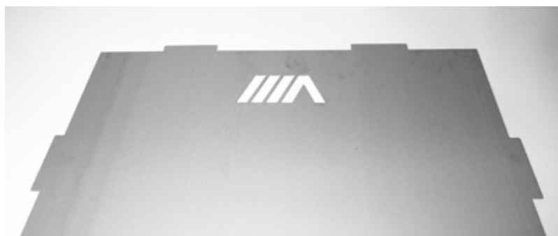
Tôle blocage de luge Sendzimir 1,2 mm