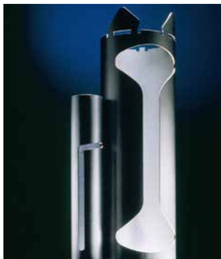
découpe de profil mixte