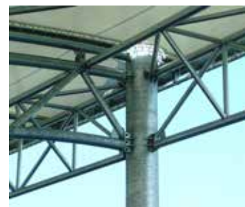
treillis métallique découpé laser