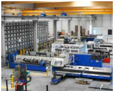
unités de découpe Laser Tube