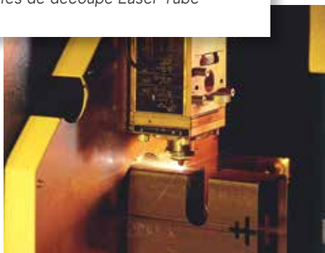
découpe laser sur tube acier