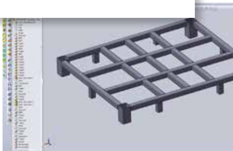
conception 3D de liaisons Tenons-Mortaises