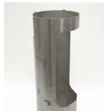
tube inox \varnothing 139,7x3