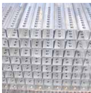
découpe de tubes en grande série