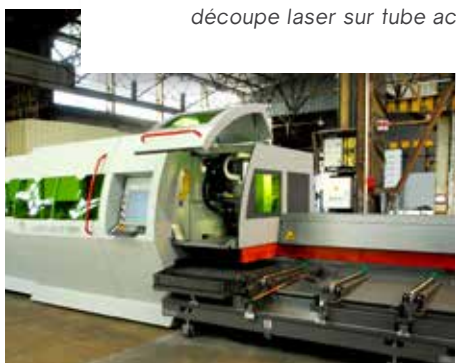
unité de découpe Laser Fibre