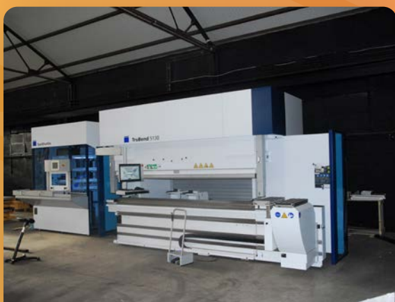
Unité et procédé de pliage