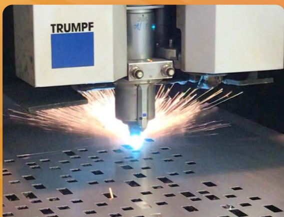
Unité et procédé de découpe laser