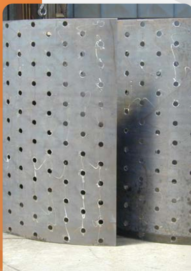
tôles perforées ép. 12