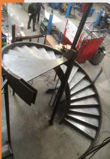
limon plat 200 ép.