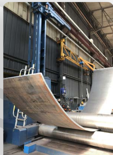
virole ép. 35