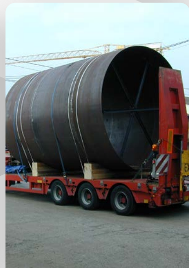
virole diamètre 3800 ép. 8