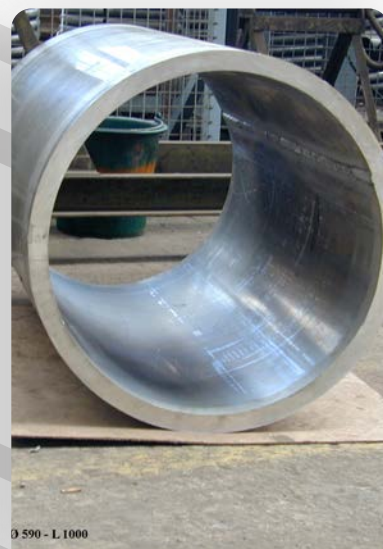
virole aluminium ép. 30