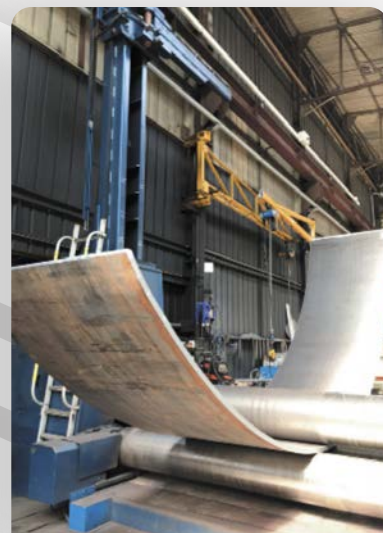
virole ép. 35