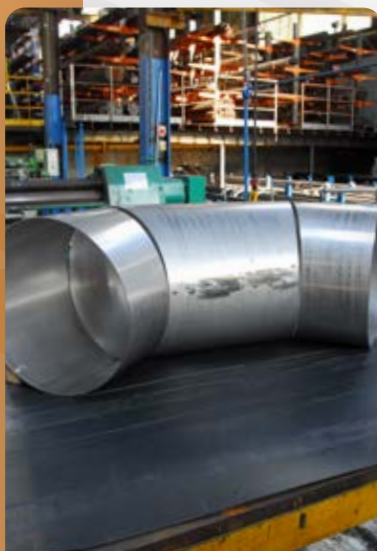
coudes en tranche