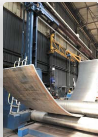
virole ép. 35