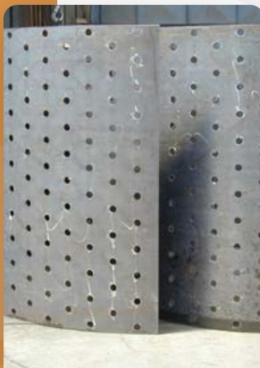
tôles perforées ép. 12