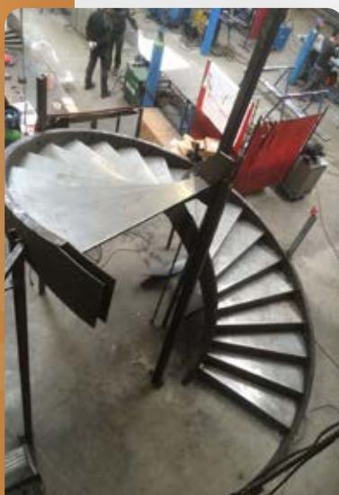
limon plat 200 ép.