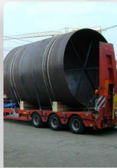
virole diamètre 3800 ép. 8