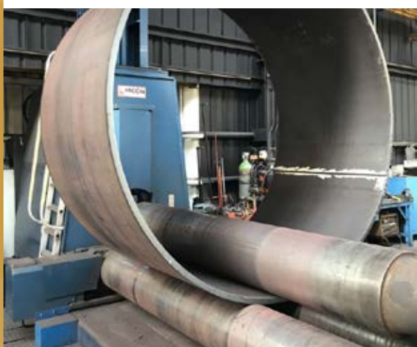
opérations de roulage

Avec nos moyens et nos compétences, nous réalisons des pièces de qualité, de l'unitaire à la grande série.