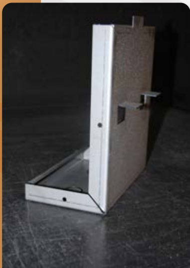
Pièce laser + pliage