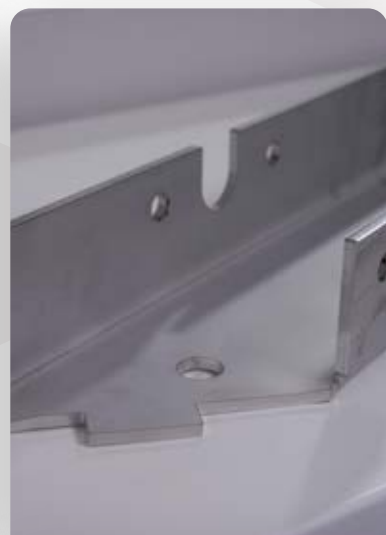
Tôle Inox ép. 5 mm découpe laser + pliage