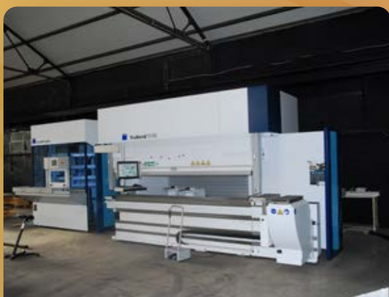
Unité et procédé de pliage