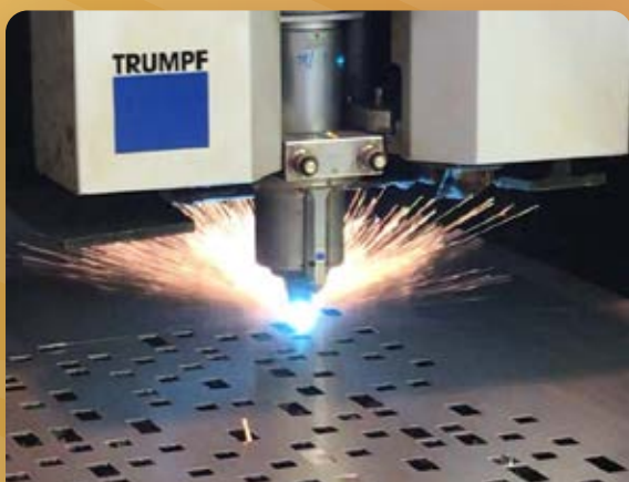
Unité et procédé de découpe laser