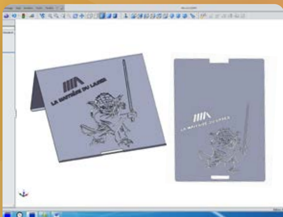
Logiciel de programmation

Avec nos moyens et nos compétences, nous réalisons des pièces de qualité, de l'unitaire à la grande série.