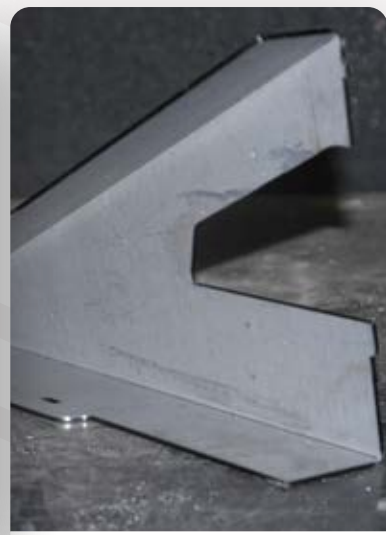
Tôle Pliée ép. 3mm