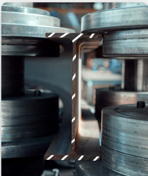
Des outils adaptés aux sections et aux matières

Avec nos moyens et nos compétences, nous réalisons des pièces de qualité, de l'unitaire à la grande série.