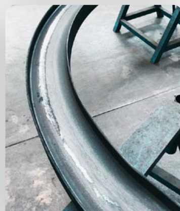
IPE 220 en grande inertie