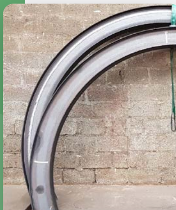
IPE 220 en grande inertie