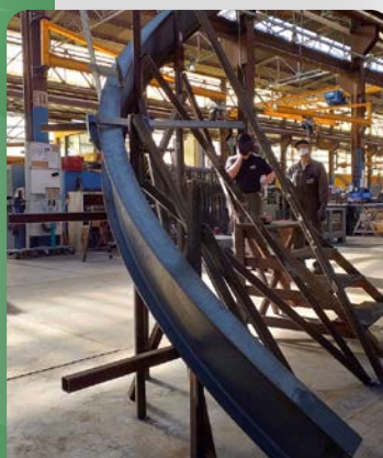
IPE 200 débillardé