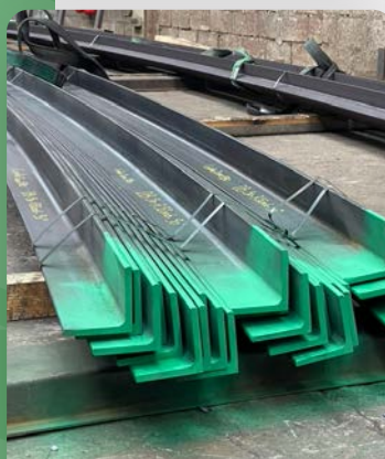
cintrage de cornières égales et inégales