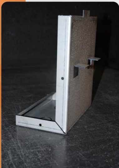
Pièce laser + pliage