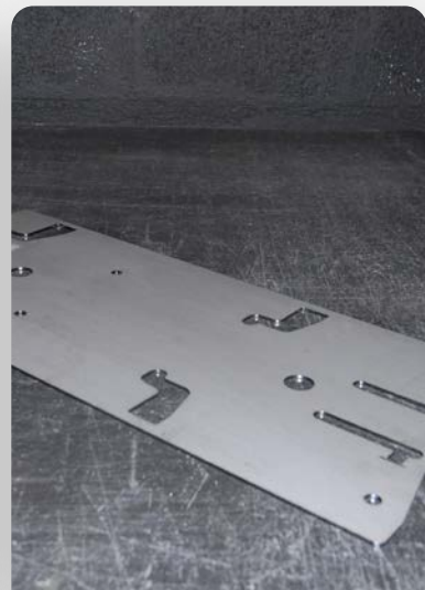
Tôle Acier ép. 4mm