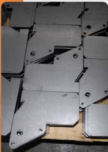
Tôle Acier ép. 8mm