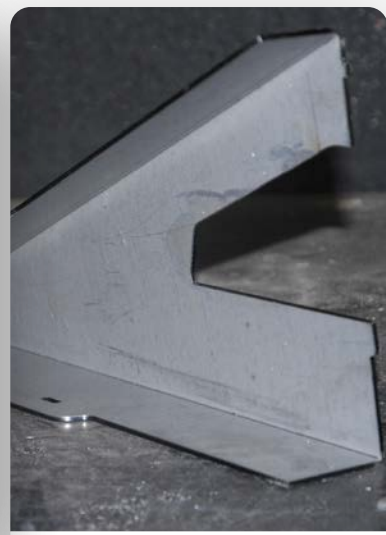
Tôle Pliée ép. 3mm