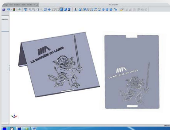
Logiciel de programmation

Avec nos moyens et nos compétences, nous réalisons des pièces de qualité, de l'unitaire à la grande série.