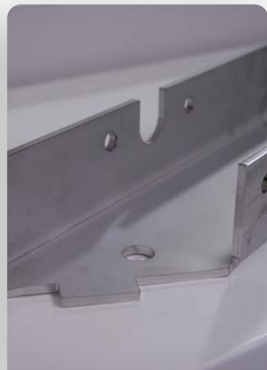
Tôle Inox ép. 5 mm découpe laser + pliage