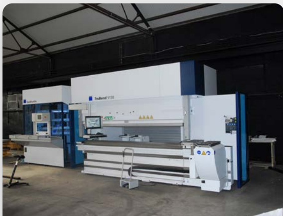
Unité et procédé de pliage