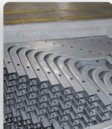
Pièce mixte laser cintrage