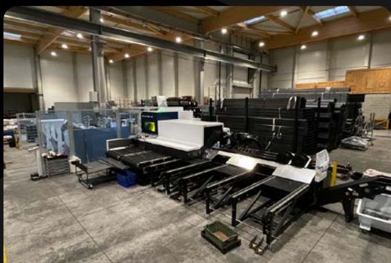
Dont 4 unités de découpe laser fibre

Avec nos moyens et nos compétences, nous réalisons des pièces de qualité, de l'unitaire à la grande série.