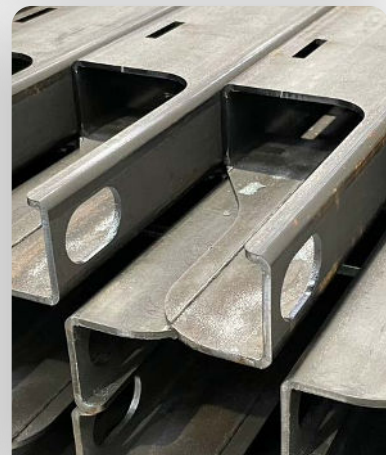
Découpe laser tube pour assemblage