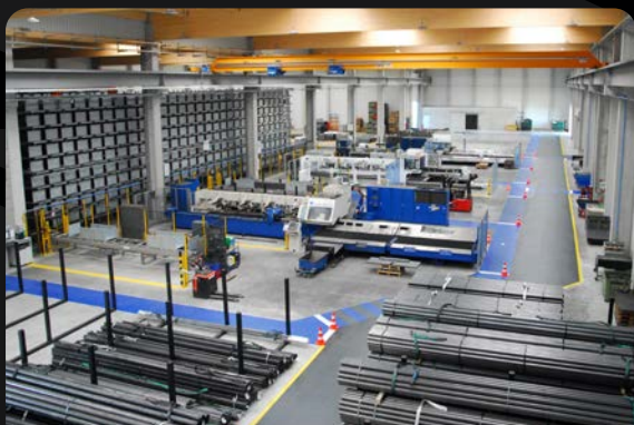
6 unités de découpe laser tube