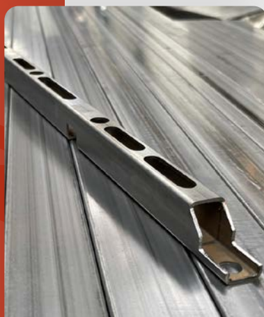
Découpe sur tube rectangulaire