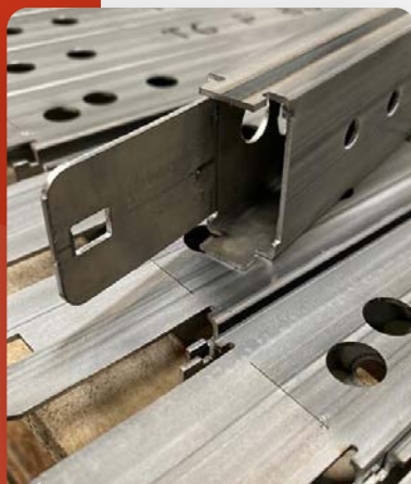
Découpe laser tube